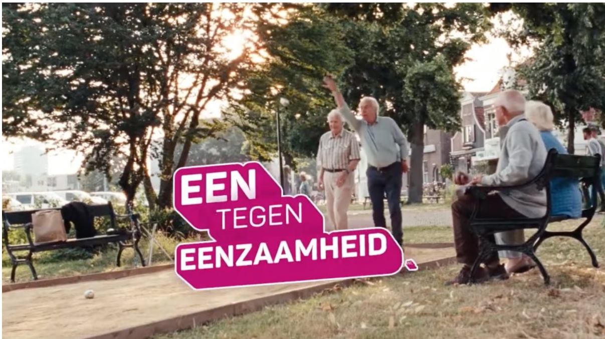
Foto zomercampagne ministerie VWS

Dit plan is geschreven voor een periode van 5 jaar. Het sluit aan op de periode van de GGD-onderzoeken die om de vier jaar plaatsvinden. Als uitgangspunt zijn wij uitgegaan van de GGD monitor 2016 en de burgerpeiling 'Waar staat je gemeente' van 2019. De eerstvolgende GGD monitor vindt plaats in 2020 en vervolgens in 2024. De burgerpeiling vindt om de twee jaar plaats.