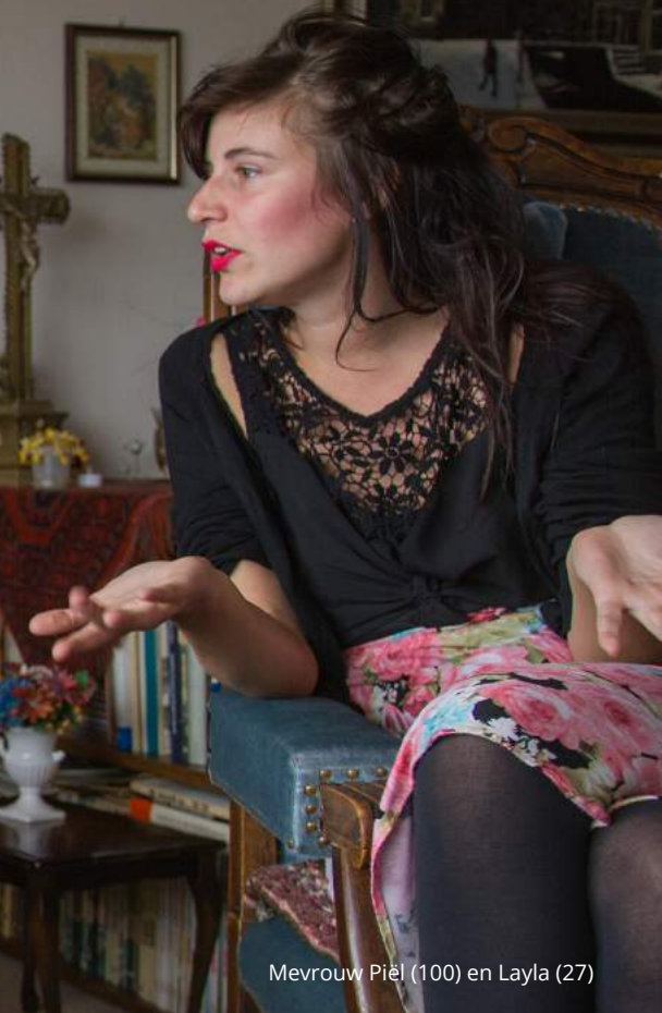
Mevrouw Piël (100) en Layla (27)