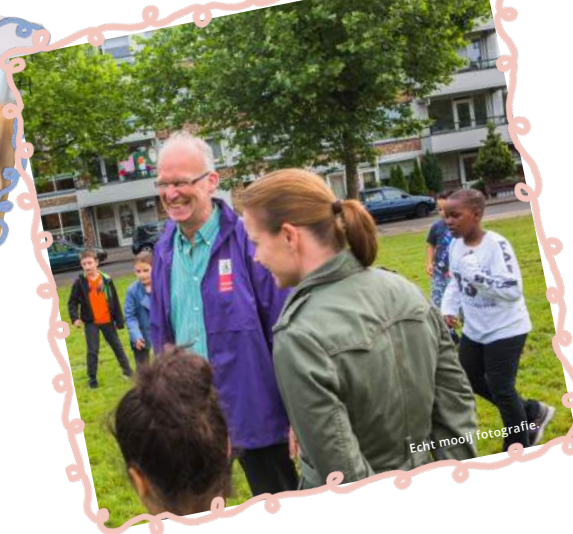
Echt mooi fotografie.

Wat ik leerde uit de pilot was dat duidelijkheid belangrijk is en om verwachtingen goed te managen aan beide kanten. Voor de scholen is het bijvoorbeeld essentieel dat het contact structureel is. Naarmate iemand langer meedraait, leren de kinderen de vrijwilliger echt kennen en hoeft de leerkracht steeds minder tijd aan begeleiding te besteden. Ze raken op elkaar ingespeeld. Vrijwilligers moeten dus weten dat ze zich verbinden voor een bepaald aantal uren per week. Als na een paar proefsessies de leerkracht en de vrijwilliger besluiten samen te blijven werken, is dat voor de rest van het schooljaar. Leergaloos is vrijwillig, maar niet vrijblijvend. Ik vertel geïnteresseerde vrijwilligers ook altijd dat leerkrachten heel erg druk zijn en dat er bijvoorbeeld geen ruimte is om gezellig samen een kop koffie te drinken tijdens schooltijd.